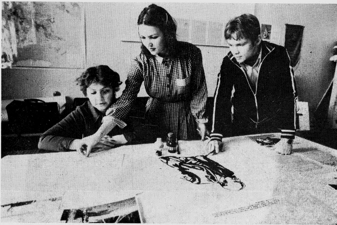
В институте заканчивается подготовка стенгазет, посвященных юбилею В. И. Ленина. Одну из лучших подготовили на теплоэнергетическом факультете.